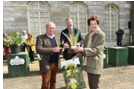
Iris 'Vicomtesse de Curel' Pépinière Cayeux