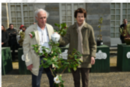
Camélia 'Vicomtesse de Curel' Monsieur Hill