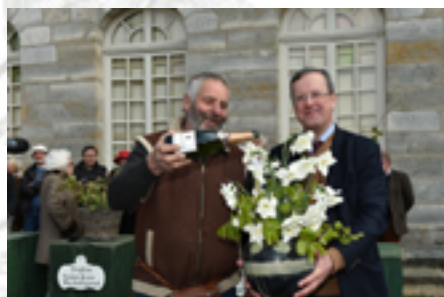
Narcisse 'Ice Dream' Gentiaan Bulborum Botanicum